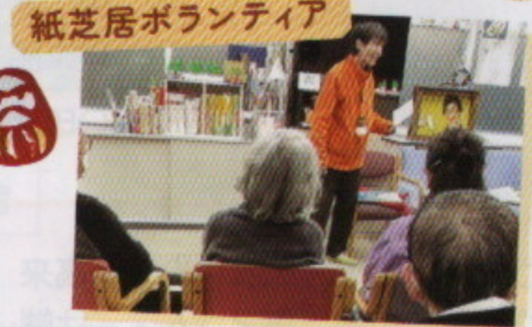
紙芝居ボランティア

昨年とは地域の方様との交流が、沢山の心あたたまる時間と過ごさ事ができました。日頃からのご支援・ご寄付に心より感謝申し上げます。