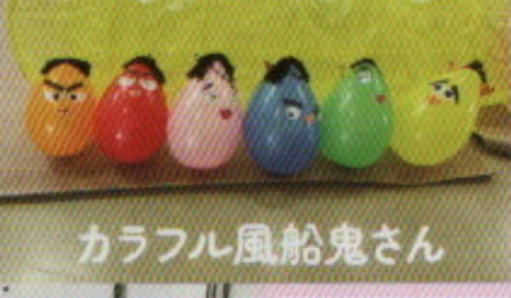
カラフル風船鬼さん