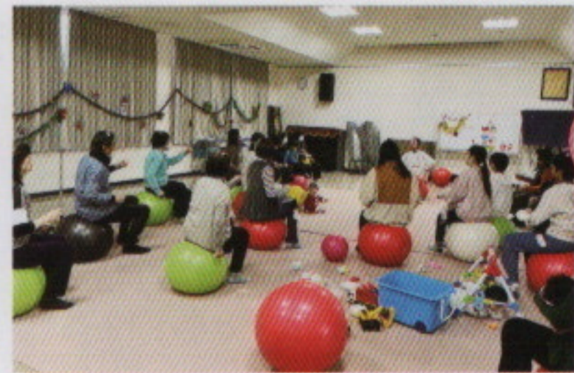
目指せ美ボディ & リフレッシュ