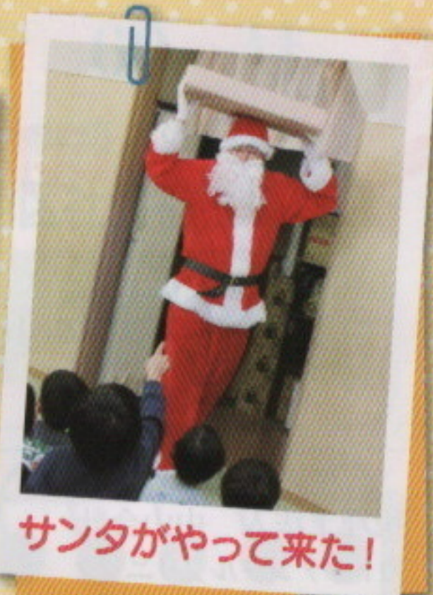
サンタがやって来た!