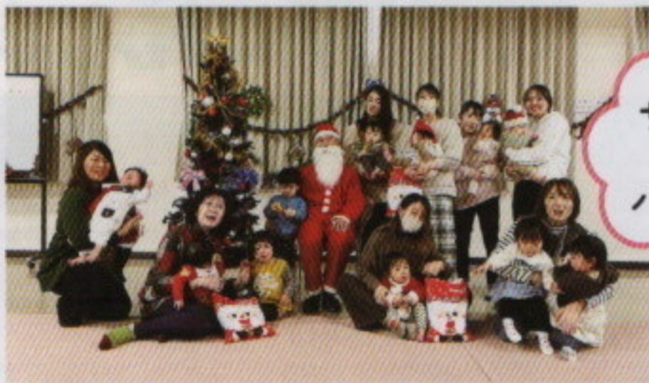
サンタさんと一緒にハイポーズ!!