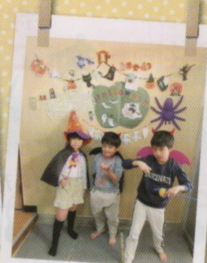
ハロウィンで衣装